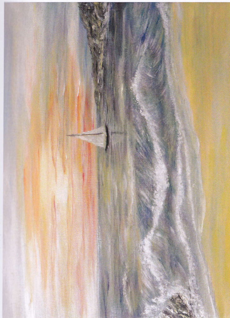
„Spre Infinit și mai Departe” Acrylic pe pânză – Corina Lupașcu 2015